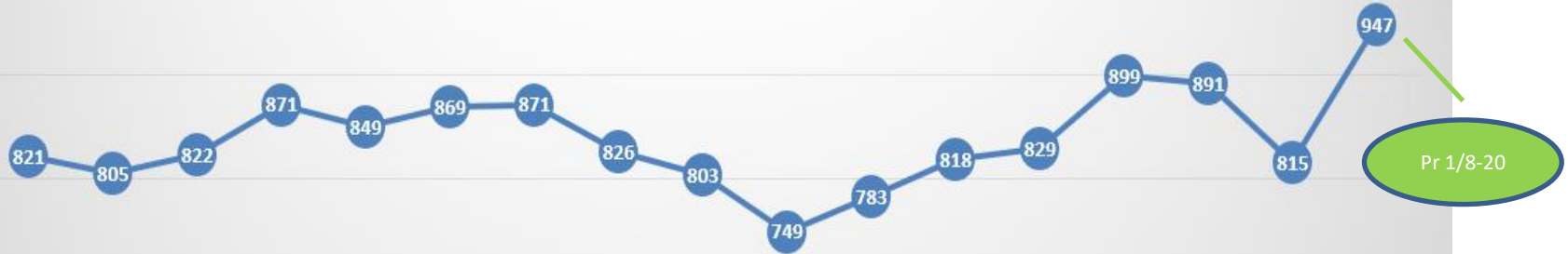
Medlemmer pr. 31/12 siden 2004

Pr. 31/12-19 blev rigtig mange udmeldt grundet manglende betaling.